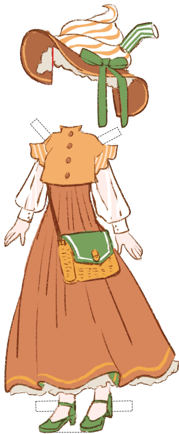
コーヒーフロート